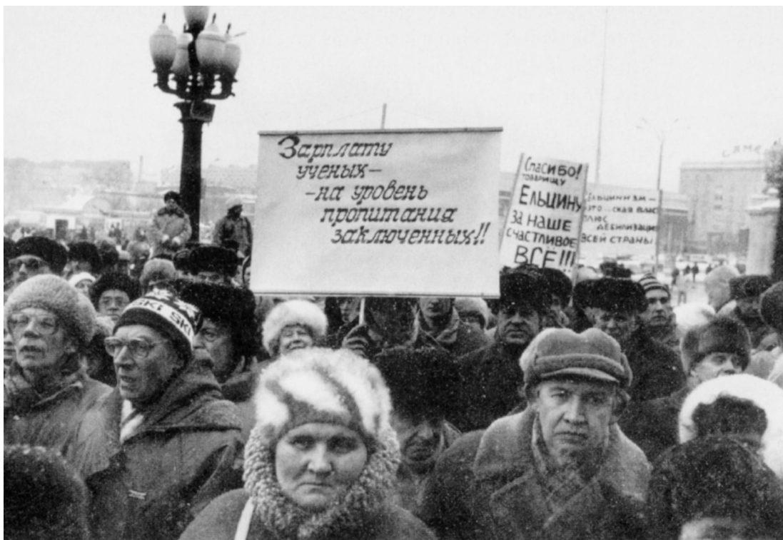
Videnskabsfolk demonstrerer mod dårlige levilkår og kræver højere løn, 1996.

gavn. Betegnelsen er misvisende, for rent-seeking er en form for profit-seeking. Disse aktiviteter kan mere dækkende betegnes som “directly unproductive profit-seeking” (DUP, udtales som dupe, engelsk: at bedrage). Det er aktiviteter, som skaber profit, men som ikke skaber produktion. De udgør et samfundsmæssigt spild i et kapitalistisk system (og i alle andre systemer), fx aktiviteter med det formål at skabe et monopol eller med det formål at udnytte statens økonomiske magt til egen fordel ved at opnå subsidier, skattefordele, gevinster ved import- og eksportregulering osv.