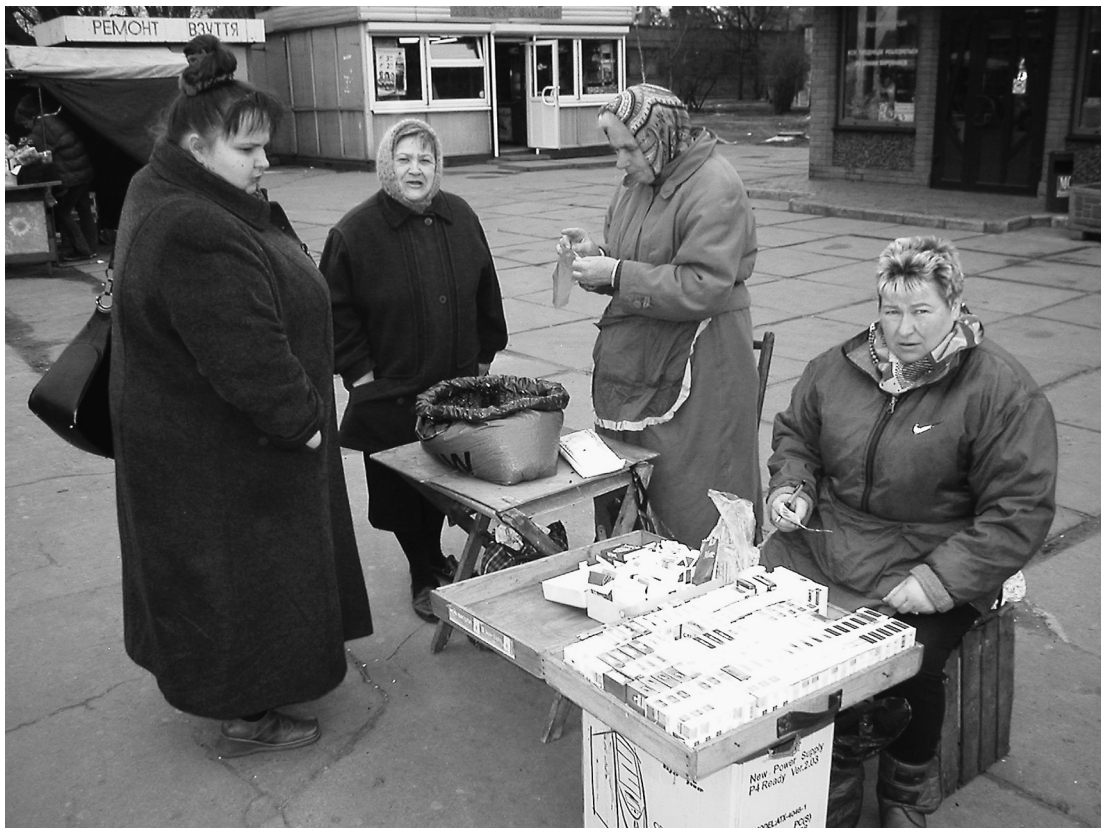
Salg af cigaretter og solsikkefrø på campingborde, Kiev 2004 (foto: Johannes Wamberg Andersen).

maximum of discontinuity without violence is desirable” (p. 451), idet “nothing shakes peoples up like a rampant crisis” (p. 453). Man må give ham ret i, at “these words may sound harsh” (p. 453).