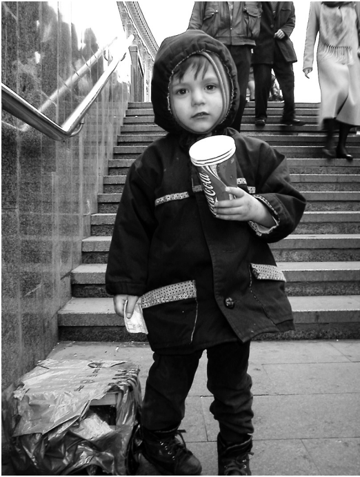
Barnetigger, Kiev 2004.

parat er det naturligvis en mulig forklaring, at hurtig og dybtgående liberalisering er årsag til, at depressionen relativt hurtigt nåede bunden i Centraleuropa. Men nærmere analyse tyder på, at sammenhængen skyldes fælles bagvedliggende forhold. Betingelserne i udgangssituationen forklarer 60% af forskellene i BNP-ændringerne 1989-1998, mens reformernes betydning forsvinder; det nævner Anders Åslund (pp. 138, 151), og han afviser det uden begrundelse. Hvis statsbudget som pct. af BNP også inddrages, kan 70% forklares, og inflation øger forklaringsgraden yderligere til 80%. Initialbetingelsernes forklaringssevne mindskes i slutningen af 90'erne. 76