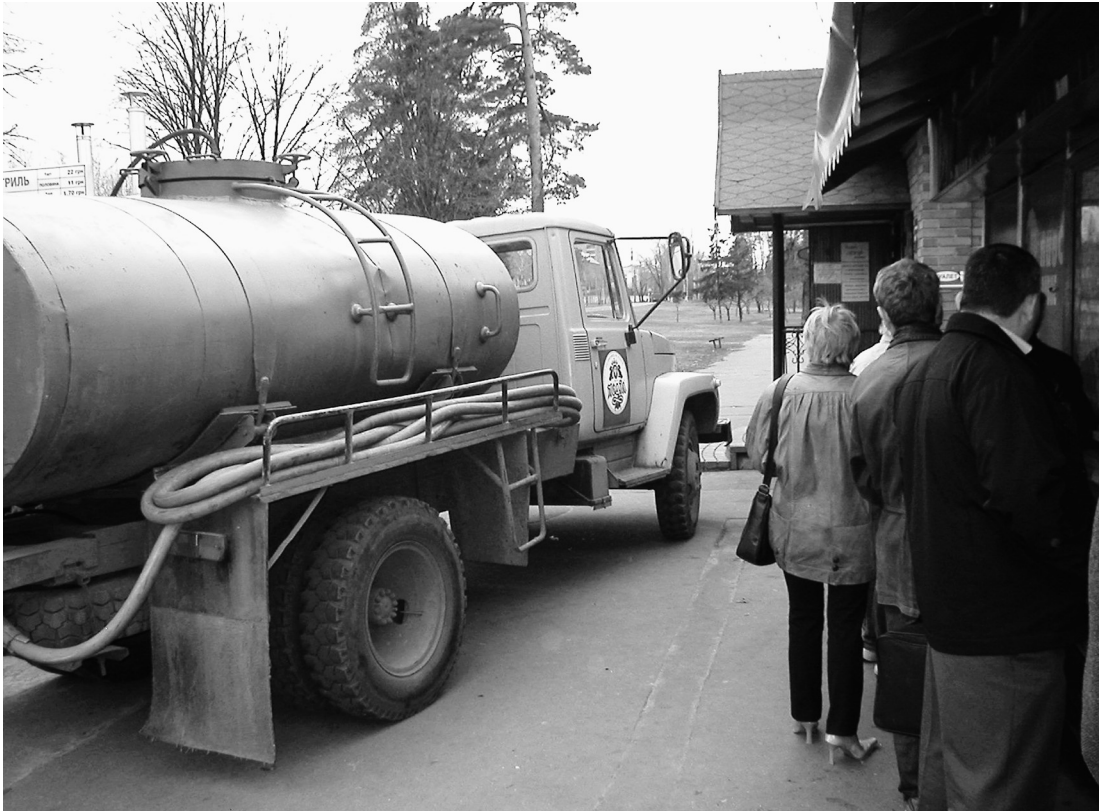
Ølbilen kører stadig med øl til 1,5 kr. for 0,5 liter fad, Kiev 2004.