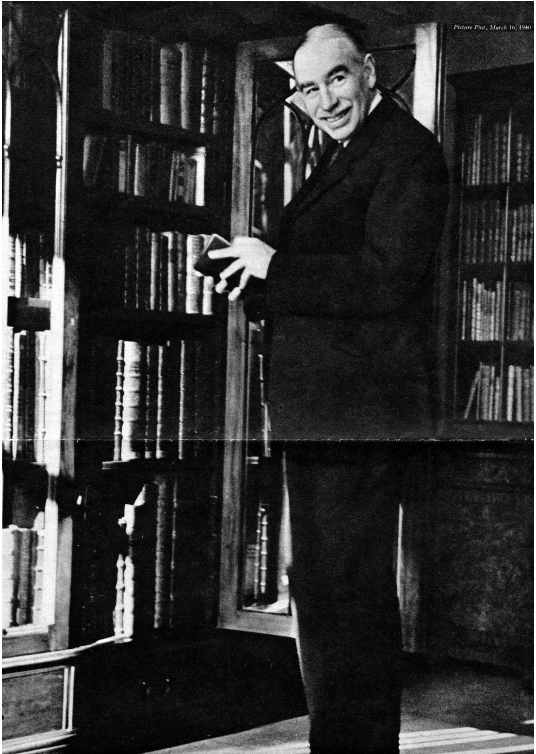
John Maynard Keynes i sit elskede bibliotek med en førsteudgave af Shakespeares sonetter.