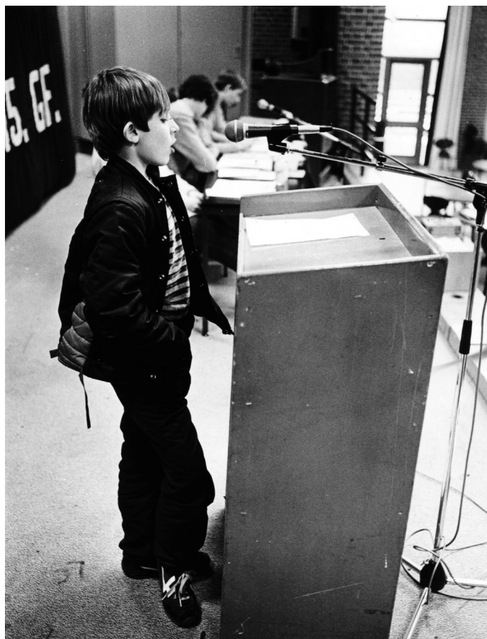
Elevbevægelsen blev for mange unge indgangen til et politisk engagement og det første møde med fagligt arbejde.

var man samlet omkring “Arbejdergrundlaget”, hvis væsentligste omdrejningspunkt var “kampen mod skolens undertrykkelse”. Folkeskolen var “det kapitalistiske systems våben mod arbejderklassens sønner og døtre”, derfor måtte elevbevægelsens vigtigste opgave være kampen mod karakterer, eksamen, niveaudeeling og ordensregler. Samtidig skulle elevbevægelsen “modarbejde den massive borgerlige inddoktrinering, som kapitalen pumper ind i skolen”, gennem en kritik af undervisningsformer, metoder og stof. En kamp LOE’s ledelse negligerede. Man var enige med DKU’erne i, at kampen mod nedskæringer og forringelser var vigtig, men det nyttede ikke noget blot at appellere til politikerne. EO kom ikke med konkrete bud, men en ting var sikkert: “Der må mere militante aktioner til og de