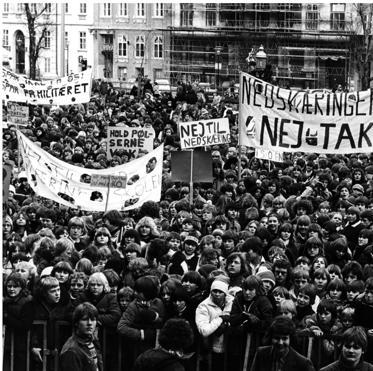
LOE samlede i slutningen af 1970'erne og starten af 1980'erne titusindvis af skoleelever til protester mod forringelser og nedskæringer. Her ses Christiansborg Slotsplads i forbindelse med den landsdækkende aktionsdag mod nedskæringer den 5. marts 1980. (Land og Folks billedarkiv, ABA).

des og eleverne komme på lejrskoler. Men sagen handlede i høj grad om sammenholdet i SV-regeringen, der ikke ville give ekstrabevillinger i et overenskomsthår. 7. februar 1979 udløstes omfattende protestdemonstrationer landet over. 25.000 på Christiansborg Slotsplads. I Ålborg og Århus over 10.000. I mindre pro-