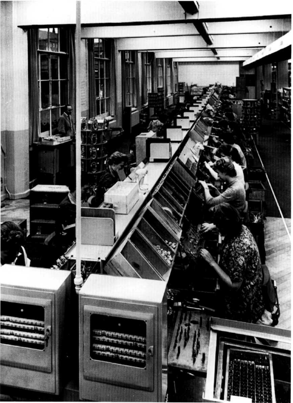
Montering affjernsyn på Philips.