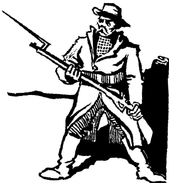
"Arbejdermagt", en nødvendighedsforanstaltning, der gik hen og blev partiprogram (til 1918). Det socialdemokratiske vittighedsblad Kurikka, 15.2.1918.

cipper og deres praktiske erfaringer med gardner og kosakker. I weekenden 27.-28. januar 1918 var alle forligsmuligheder udtømte, der fandt to samtidige, modsatrettede statskup sted. I byen Vasa greb den tsarrussiske general Mannerheim magten ved hjælp af de nyoprettede hvide gardner eller hjemmeværn. I Helsingfors og i de fleste store byer i øvrigt tog arbejderbevægelsens folk magten, støttet på røde gardner. Fra og med slutningen af januar var landet territorielt delt mellem Hvide i nord og øst, Røde i syd. De hvide styrker indledte straks udrensningssaktioner i de store arbejderbyer i Midt- og Nordfinland; til gengæld blev hjemmeværnsafdelinger i Røde Finland fordrevet eller interneret.