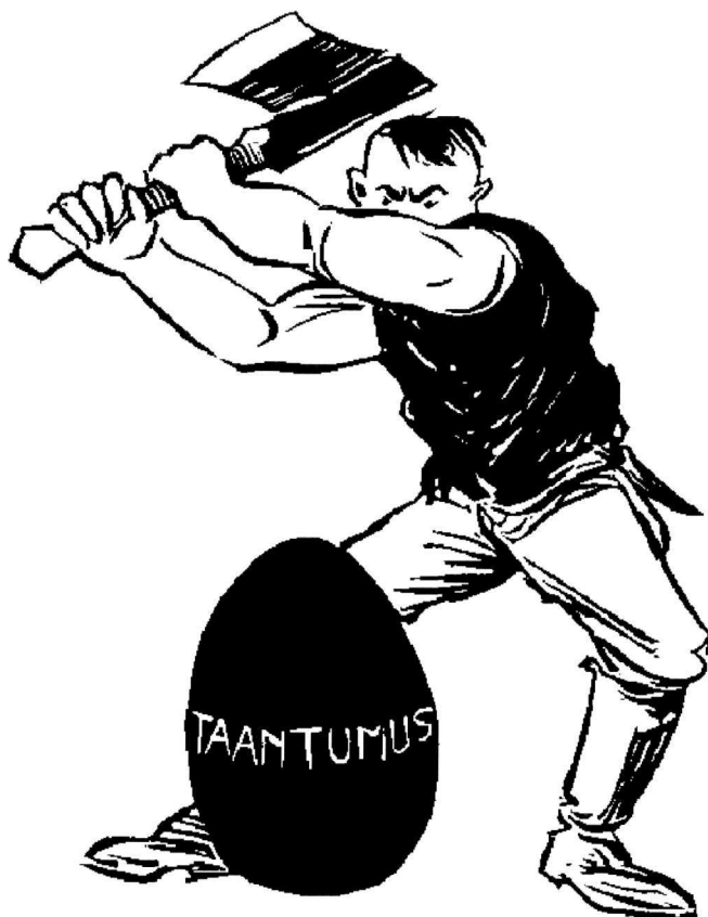
"Skovarbejdernes påskeæg" -fra det socialdemokratiske vittighedsblad Kurikka 1.4.1918. På ægget står der REAKTIONEN.

des under disse forhold; dens politiske organisation måtte altså efter omstændighederne blive en befrielsesfront. Dette er en vigtig nøgle til forståelsen af arbejderbevægelsen i Finland: målet var det sociale demokrati, efter alt at dømmes kunne det alene opnås ved fuldstændig løsrivelse fra Det russiske Imperium, hvorfor man først måtte arbejde på selvstændigheden.