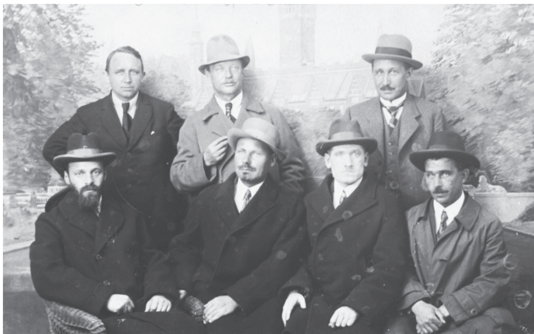
Bestyrelsen for Dansk-Russisk Samvirke fotograferet i Tivoli i 1924 sammen med den russiske landbrugskommission.