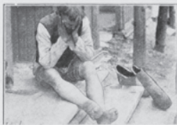
I Tusindvis faar de flygtende Hunger-Skarbag og lades tilbage.