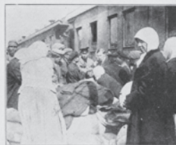
De indfangte og optagne flygtende indskrives inden de køres bort til Forplejningsstationerne.

Agitér for Tilslutning til dette interessante Møde!