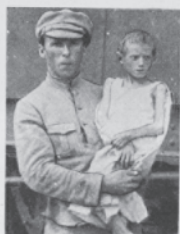
Den røde Soldat bærer de hungrende Børn paa sine stærke Arme.