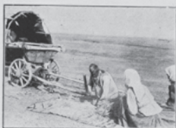
Det sidste Korn sættes under Flugten.

Solbranden, Folkflugten, Hungerens Lidelser, Sygdom og Død, det store Sammenbrud, Hjelpekationen organiseres og iværksættes, Rædslen paa de store Steppe, Børnenes Frelse, Sygdommens Bekæmpelse, Koncentrationslejrene, Millionernes Ernæring, det russiske Folks Opforelse. — Hvad kan vi gøre for at hjælpe!