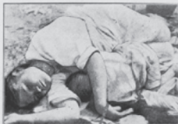
Langt Vejene falder Menneskene om af Udmattelse.

For 2 Kroner om Ugen kan du opretholde Livet i et lille Hungerbarn. Bliv et lille Hungerbarns Forsørger i denne Vinter!