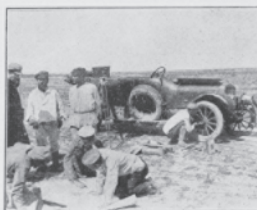
Møless Bilen, der søger efter de flygtende Karavaner, repareres, stades Korlet over de usendelige Stepper.