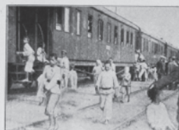
Sanitetsvog med optagne Hungerbarn.