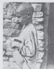
Ved at spise Bærbrød og Lerjord faar Børnene Hunger-Skarbag.